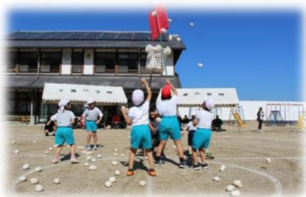
タマイレ ～運動場の決戦～