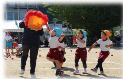
タマイレ ～運動場の決戦～