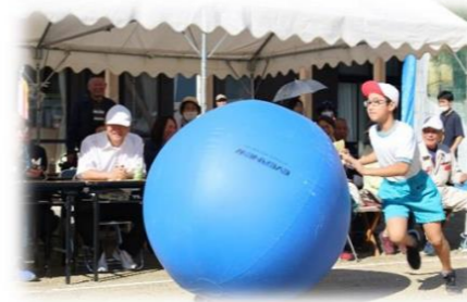
回る玉へ 大玉物語