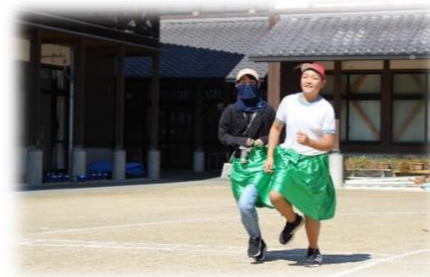
しもなだのこのこしたんたん