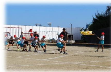
引きの子 ～綱引き合戦～