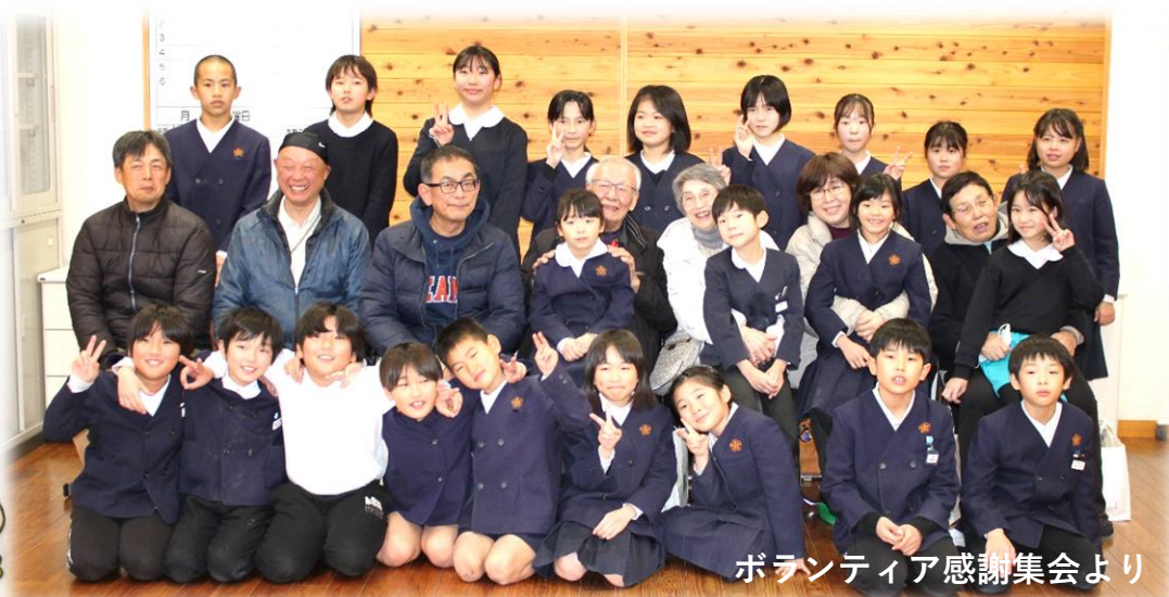
ボランティア感謝集会より

わたしは、「最」にしました。小学校最後の年でもあるし、その年に最高の思い出を作りたいなと思ったからです。そのためにも、一日一日を大切にしたいです。